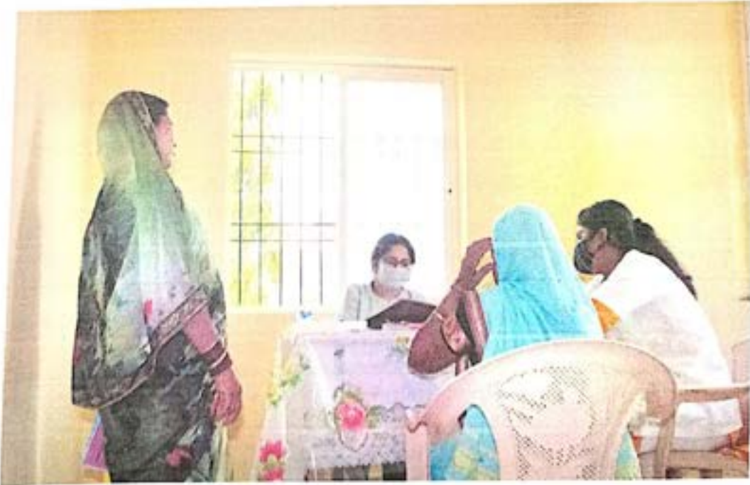
महिलां रोंगीचे आरोग्य तपासताना स्त्रीरोगतज्ज्ञ