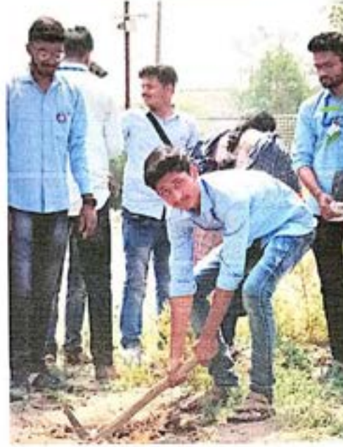
झाडांना आळे करताना स्वयंसेवक