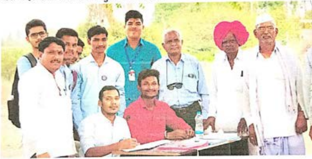
आरोग्य तपासणी शिबिराला येणाऱ्या गावकर्यांची नोंदणी करताना स्वयंसेवक

दि. २४/०३/२०२२ रोजी गावकर्यांसाठी गावात मोफत आरोग्य तपासणी शिबीराचे आयोजन एम. आय. टी. हॉस्पिटल व महाविद्यालयाच्या वतीने करण्यात आले होते. या शिबिरामध्ये गावातील महिलांना स्त्रीरोगतज्ञ यांनी आरोग्याविषयी माहिती दिली. त्यानंतर आरोग्य शिबीर सुरु करण्यात आले यादिवशी सुद्धा स्वयंसेवकानी शाळेय विद्यार्थ्यांना माहिती तंत्रज्ञान या विषयी माहिती दिली. यादिवशी आरोग्य शिबिरात महिलांसाठी स्त्रीरोगतज्ञ सुद्धा उपस्थित होते.