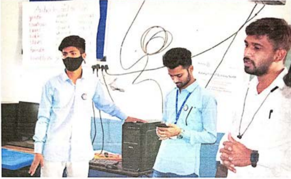
शाळेतील विद्यार्थ्यांना संगणक विषयी माहिती दिली