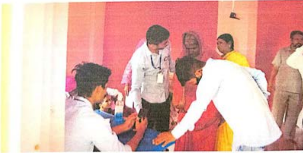
आरोग्य तपासणी शिबिराला आलेल्या गावकर्यांशी संवाद साधताना स्वयंसेवक