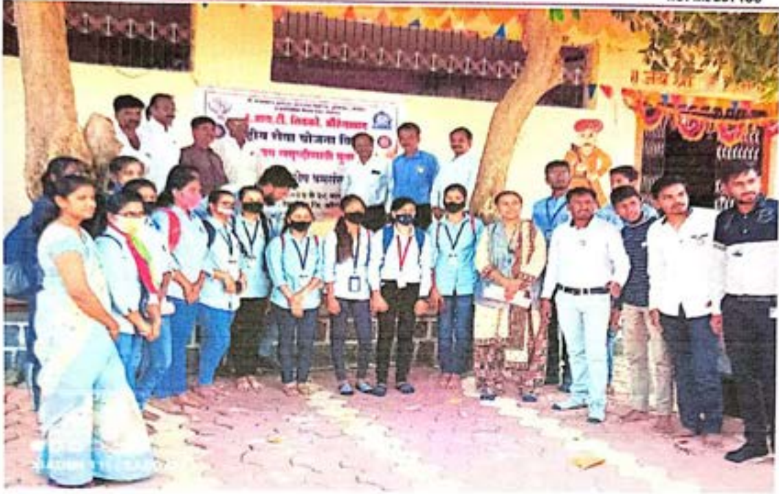
कार्यक्रमाच्या उद्घाटन प्रसंगी मान्यवर व स्वयंसेवक