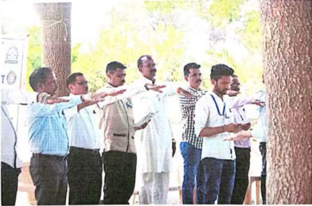
राष्ट्रीय सेवा योजनेची प्रतिज्ञा घेताना प्रमुख अतिथी