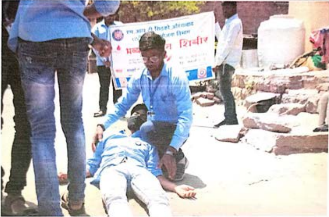
"रक्तदान करा जीव वाचवा" या विषयावर पथनाट्य करताना स्वयंसेवक