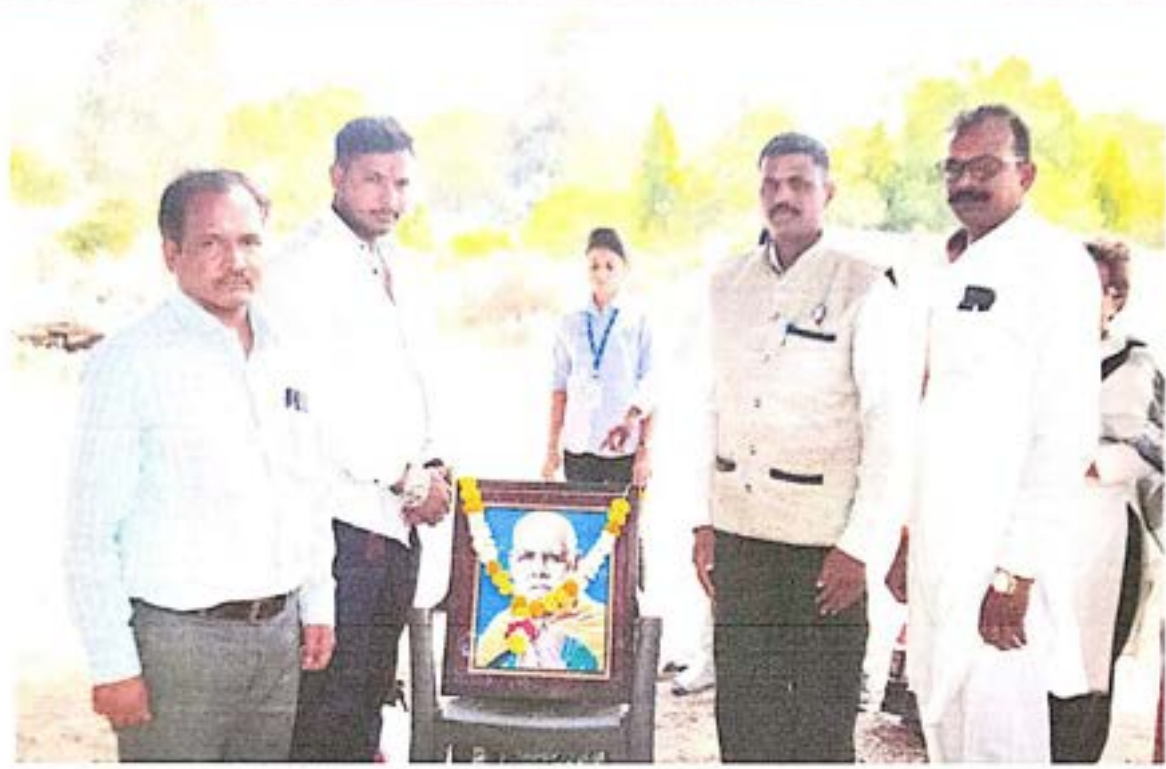
प्रतिमा पूजन करताना मान्यवर