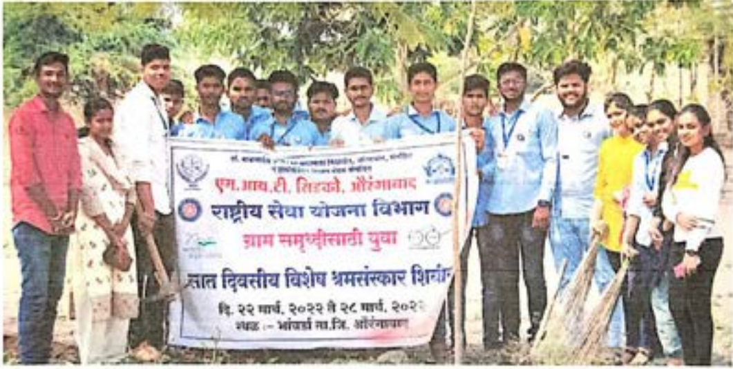
झाडांना आळे करताना स्वयंसेवक