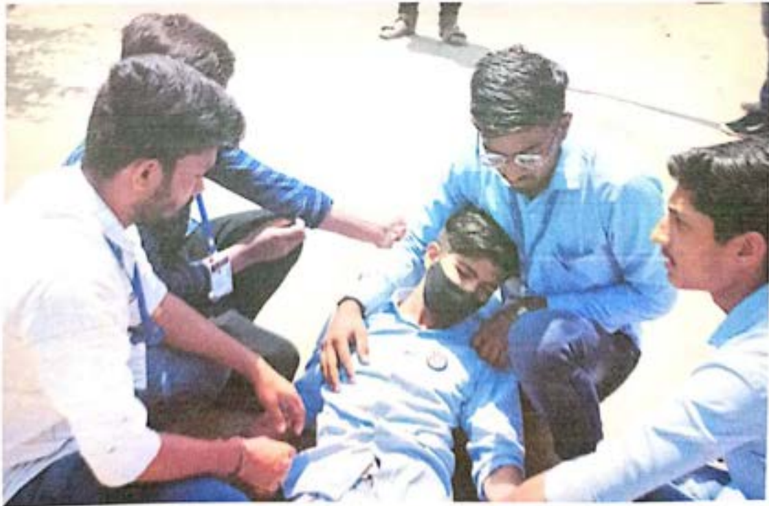
रक्तदान करा जीव वाचवा या विषयावर पथनाट्य करताना स्वयंसेवक

[Signature] N.S.S. (MH-04/397611) Programme Officer MIT CIDCO, N-1,