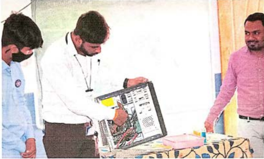
शाळेतील विद्यार्थ्यांना संगणक विषयी माहिती दिली