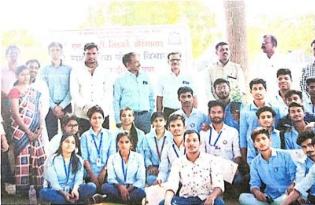
राष्ट्रीय सेवा योजनेची समारोप करताना स्वयंसेवक व प्रमुख अतिथी