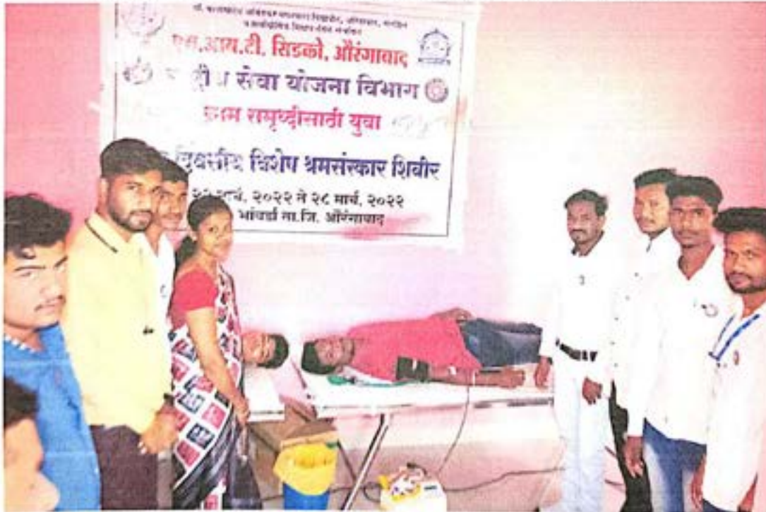
रक्तदान करताना स्वयंसेवक