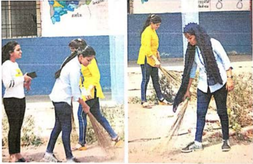
शाळेय परिसर स्वच्छ करताना स्वयंसेवीका

N.S.S. (MH-04) 397044 Programme Officer MIT CIDCO, N-4, Aurangabad