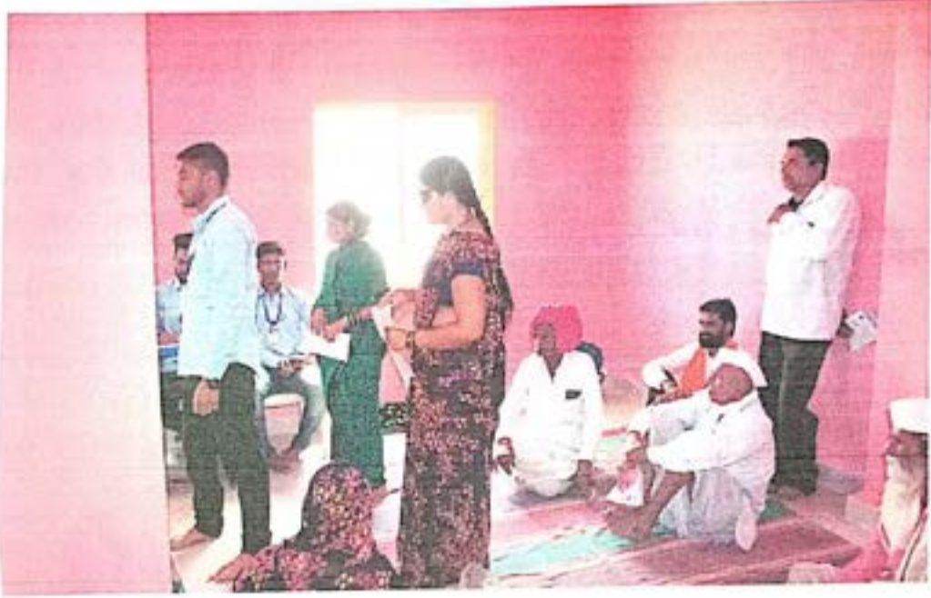
आरोग्य तपासणी शिबिराला आलेले गावकरी