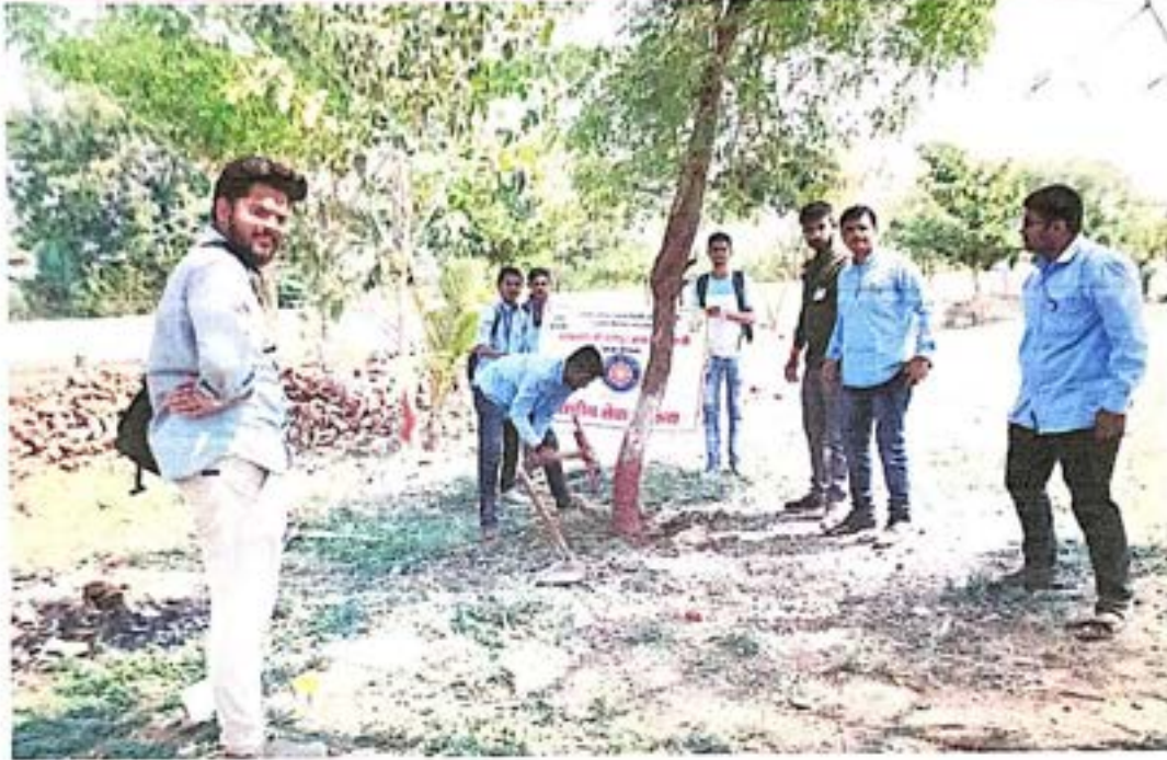
उर्वरित झाडांना आळे करताना स्वयंसेवक