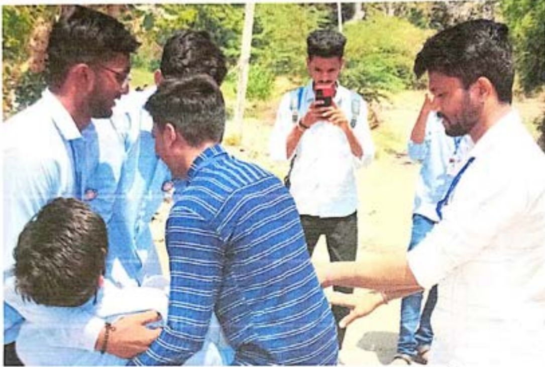
रक्तदान करा जीव वाचवा या विषयावर पथनाट्य करताना स्वयंसेवक