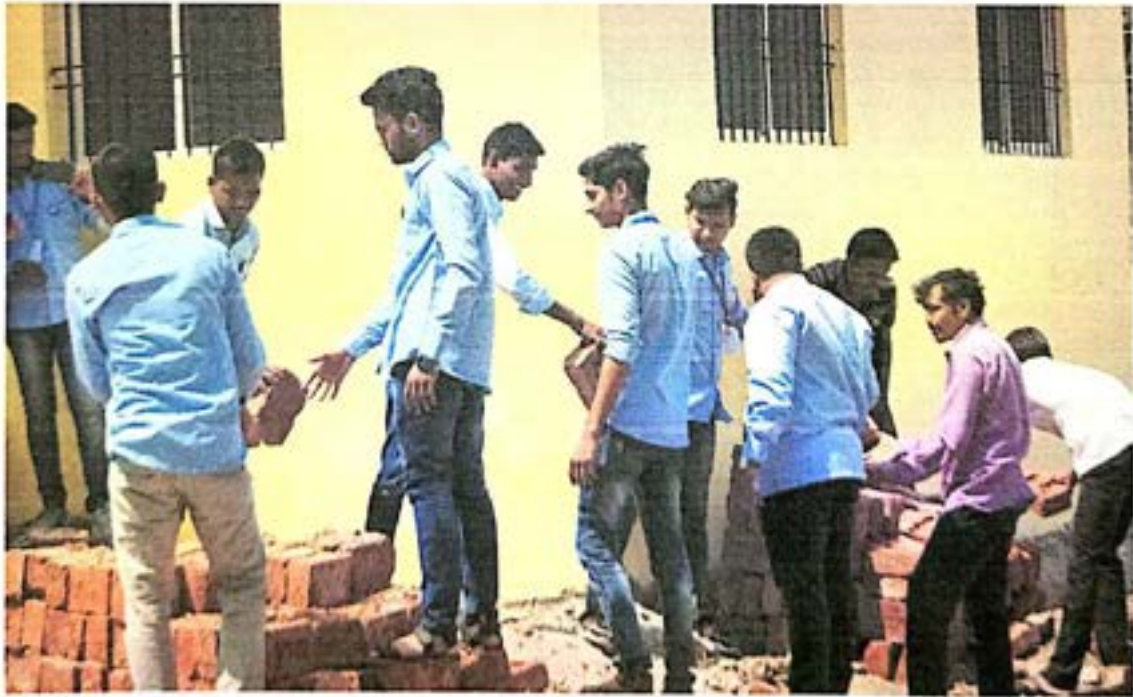
ग्रामपंचायत समोरील स्वच्छता करताना स्वयंसेवक