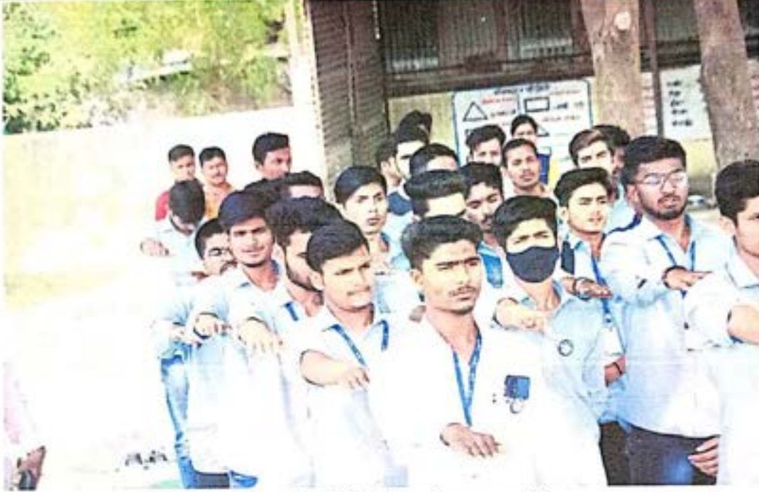
राष्ट्रीय सेवा योजनेची प्रतिज्ञा घेताना स्वयंसेवक