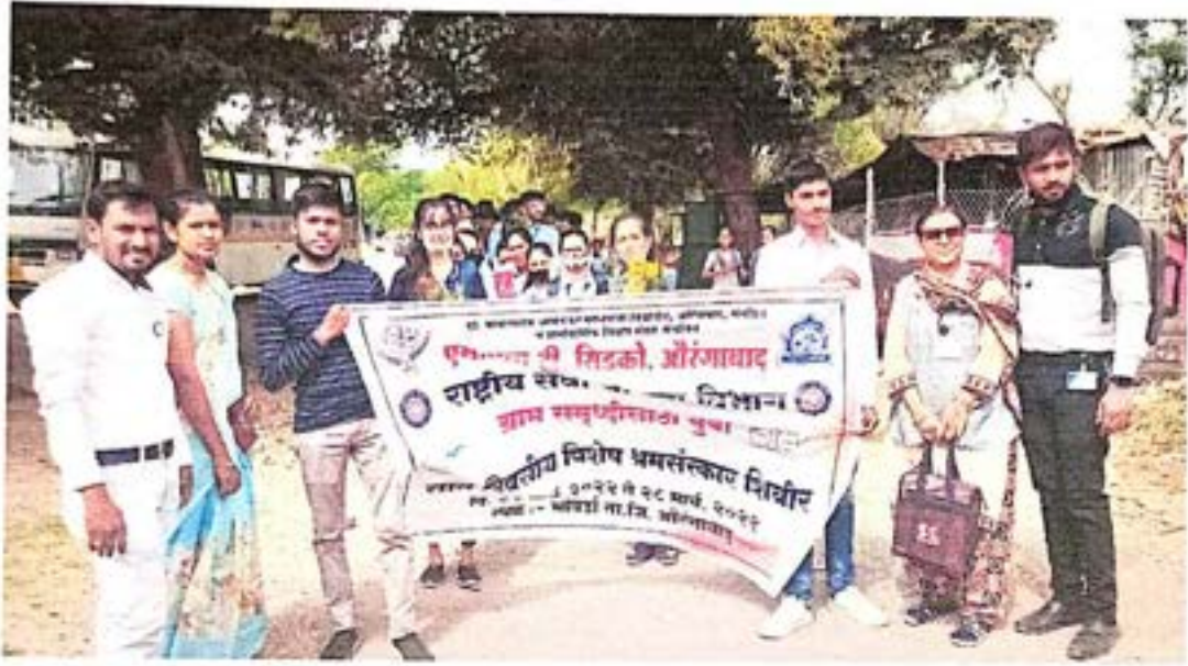
प्रमात फेरी प्रारंभ