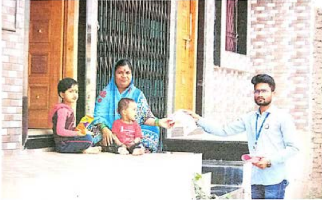
पत्रिका वाटून मेडीकल कॅम्प विषयी गावकर्यांना माहिती देण्यात आली