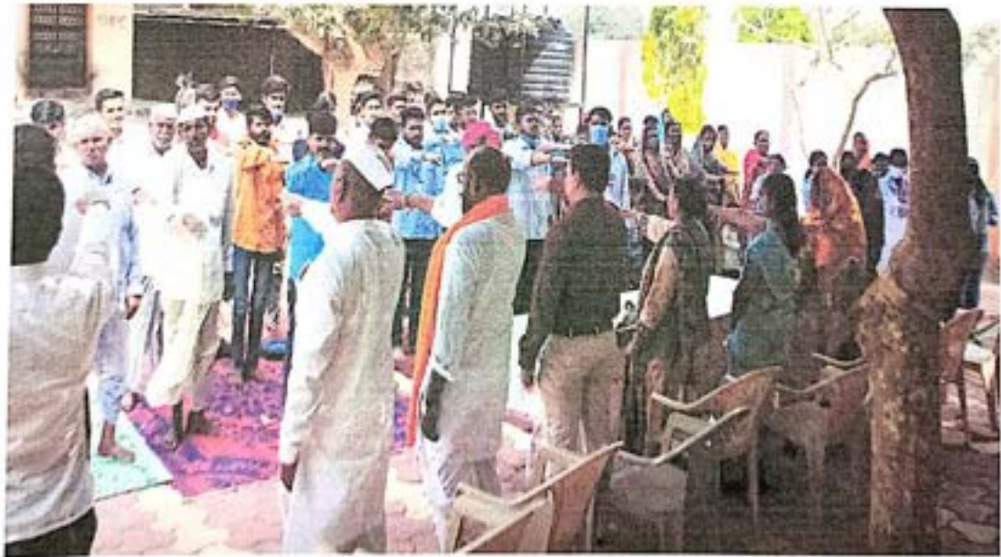
जलसंवर्धन शपथ घेताना स्वयंसेवक व गावकरी