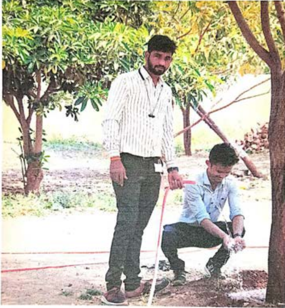
शाळेतील झाडांना पाणी देताना स्वयंसेवक