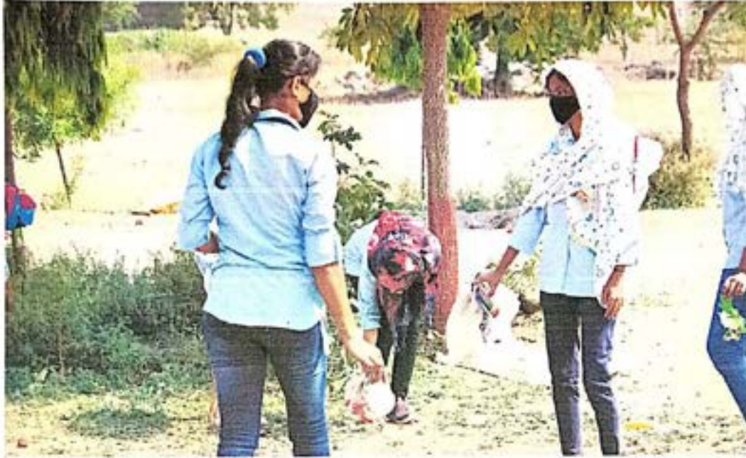
शाळेय परिसर स्वच्छ करताना स्वयंसेवीका