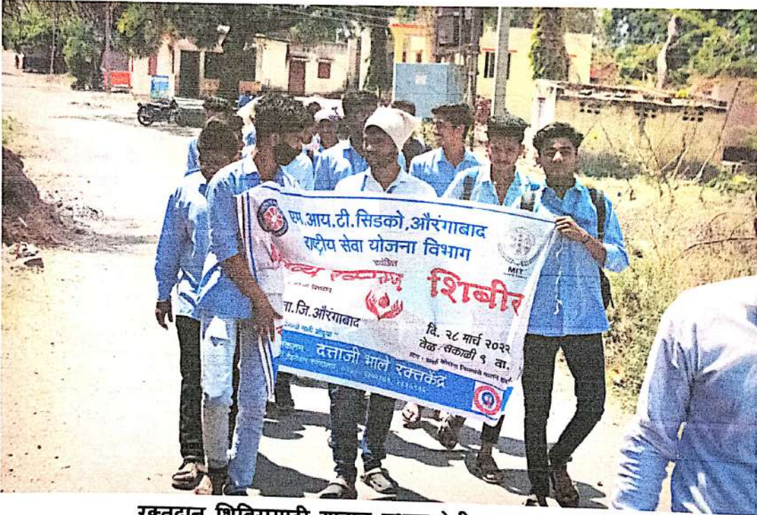
रक्तदान शिबिरासाठी गावात प्रभात फेरी काढण्यात आली