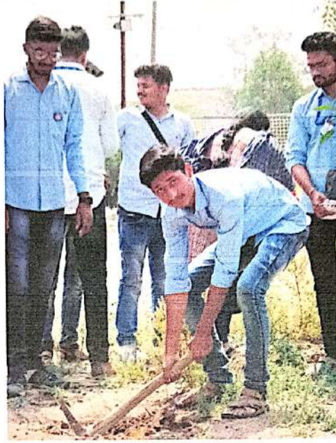
झाडांना आळे करताना स्वयंसेवक