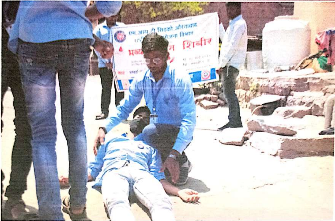
“रक्तदान करा जीव वाचवा” या विषयावर पथनाट्य करताना स्वयंसेवक