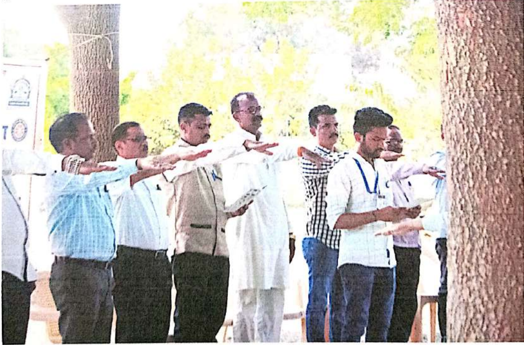
राष्ट्रीय सेवा योजनेची प्रतिज्ञा घेताना प्रमुख अतिथी