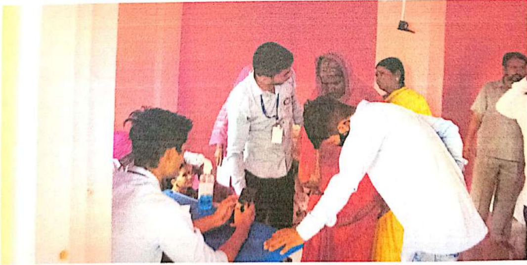
आरोग्य तपासणी शिबिराला आलेल्या गावकर्यांशी संवाद साधताना स्वयंसेवक