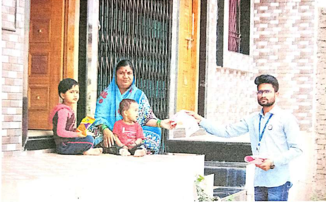
पत्रिका वाटून मेडीकल कॅम्प विषयी गावकर्यांना माहिती देण्यात आली