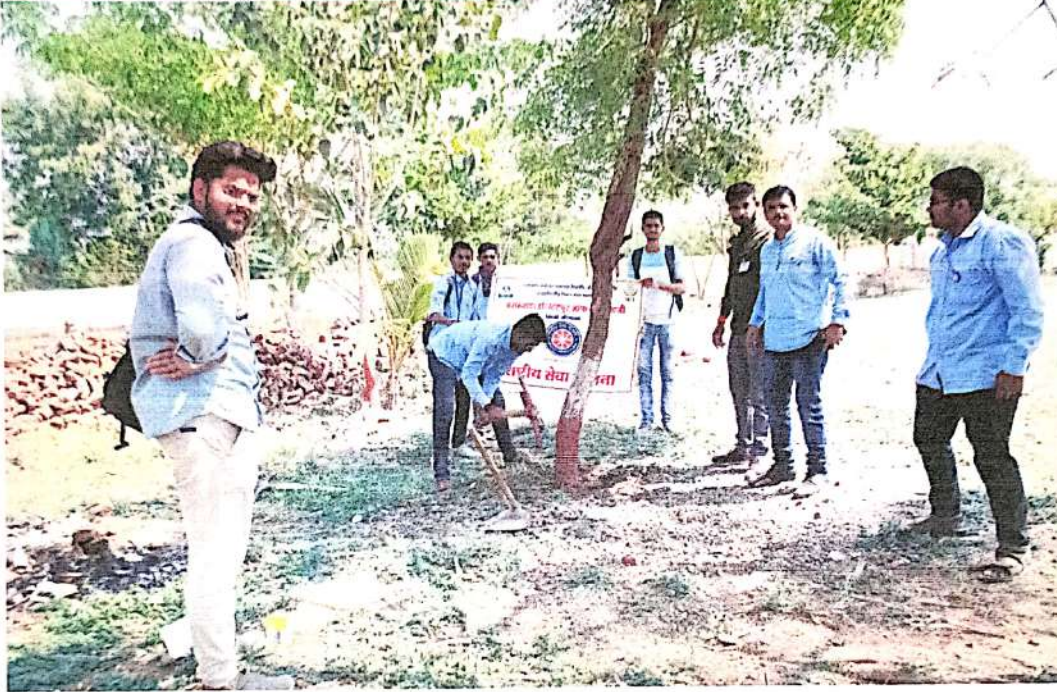
उर्वरित झाडांना आळे करताना स्वयंसेवक