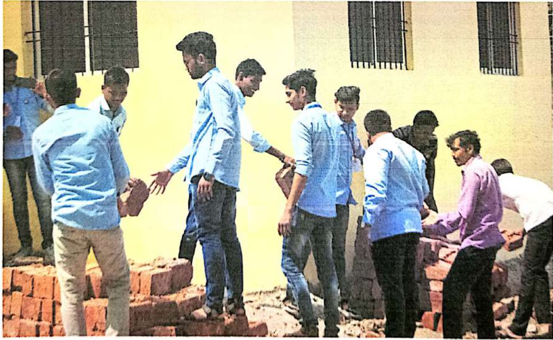
ग्रामपंचायत समोरील स्वच्छता करताना स्वयंसेवक