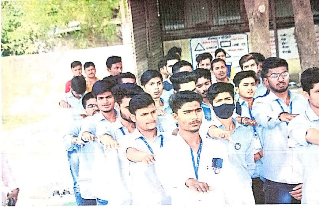
राष्ट्रीय सेवा योजनेची प्रतिज्ञा घेताना स्वयंसेवक