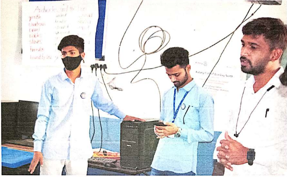
शाळेतील विद्यार्थ्यांना संगणक विषयी माहिती दिली