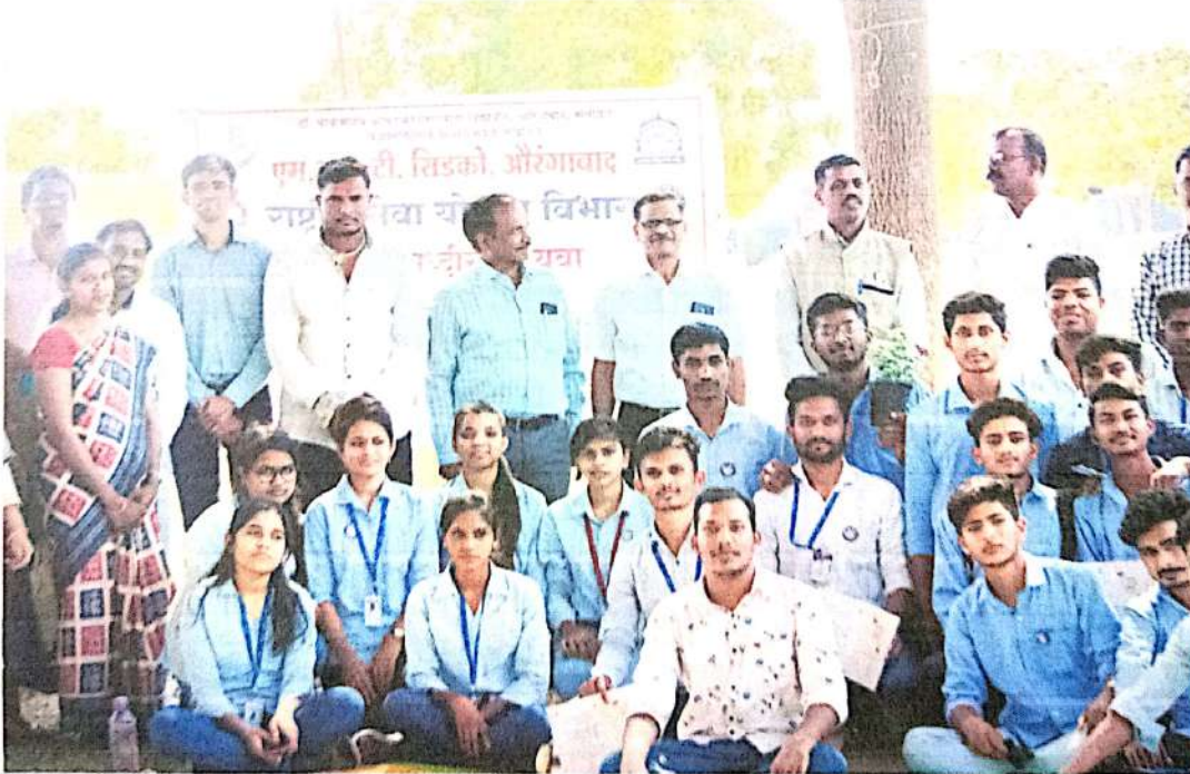
राष्ट्रीय सेवा योजनेची समारोप करताना स्वयंसेवक व प्रमुख अतिथी