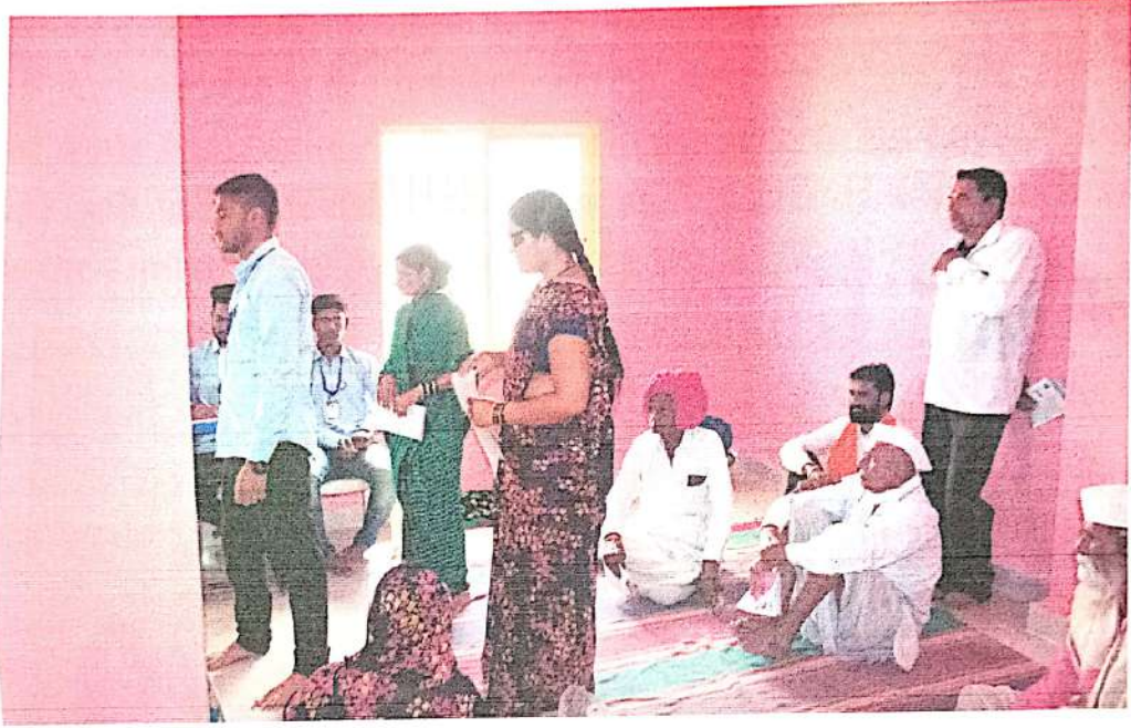
आरोग्य तपासणी शिबिराला आलेले गावकरी