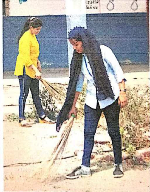
शाळेय परिसर स्वच्छ करताना स्वयंसेवीका

[Signature] N.S.S. (MH-04/397011) Programme Officer MIT CIDCO, N-4, Aurangabad.