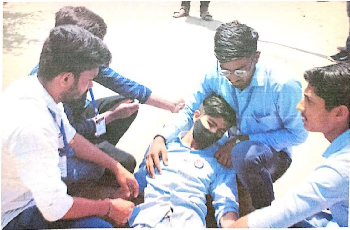
रक्तदान करा जीव वाचवा या विषयावर पथनाट्य करताना स्वयंसेवक

[Signature] N.S.S. (MH-04/39/011) Programme Officer MIT CIDCO, N-1, Aurangabad