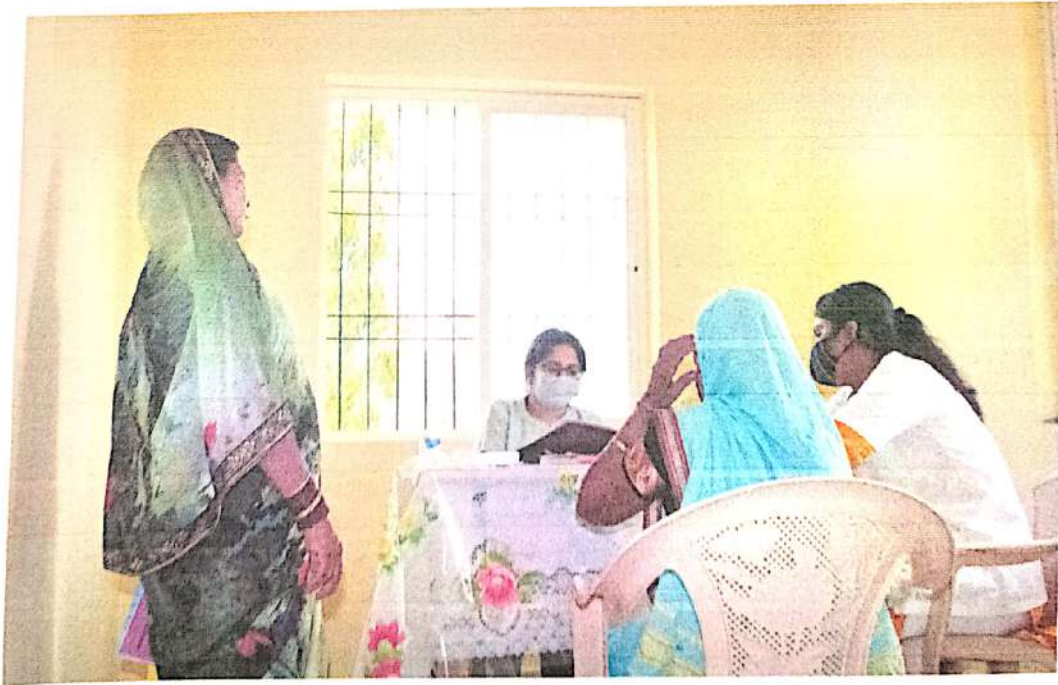
महिलां रोंगीचे आरोग्य तपासताना स्त्रीरोगतज्ज्ञ