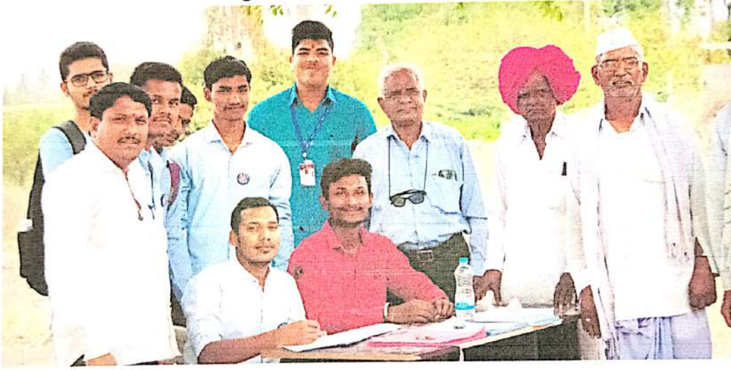
आरोग्य तपासणी शिबिराला येणाऱ्या गावकर्यांची नोंदणी करताना स्वयंसेवक

दि. २४/०३/२०२२ रोजी गावकर्यांसाठी गावात मोफत आरोग्य तपासणी शिबिराचे आयोजन एम. आय. टी. हॉस्पिटल व महाविद्यालयाच्या वतीने करण्यात आले होते. या शिबिरामध्ये गावातील महिलांना स्त्रीरोगतज्ञ यांनी आरोग्याविषयी माहिती दिली. त्यानंतर आरोग्य शिबीर सुरु करण्यात आले यादिवशी सुद्धा स्वयंसेवकानी शाळेय विद्यार्थ्यांना माहिती तंत्रज्ञान या विषयी माहिती दिली. यादिवशी आरोग्य शिबिरात महिलांसाठी स्त्रीरोगतज्ञ सुद्धा उपस्थित होते.